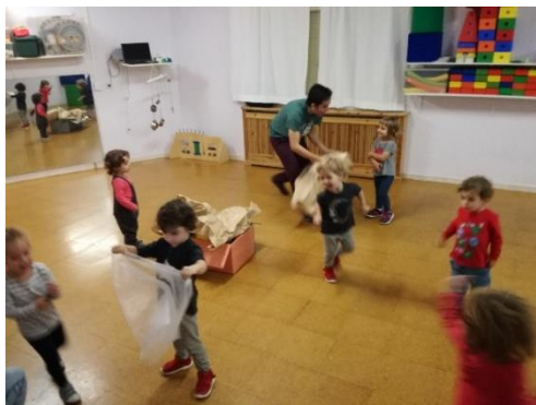
imagen 35: escondiéndonos de la lluvia

Finalmente, el papel que recubría la caja tenía muchas posibilidades y se me ocurrió jugar a la lluvia con los niños. Al moverlo con fuerza sonaba similar a la lluvia y promovió una reacción en los niños lógica que fue correr y apartarse de la lluvia.