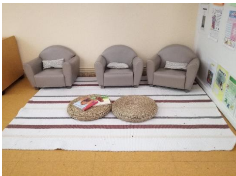
imagen 11: ambiente que invita a la lectura jardín Els Pins

gran co-protagonismos de los sentidos en la construcción y elaboración del conocimiento y de la memoria personal y de grupo.