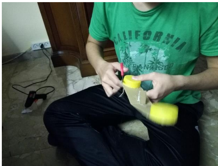
imagen 28: elaboración de las castañuelas