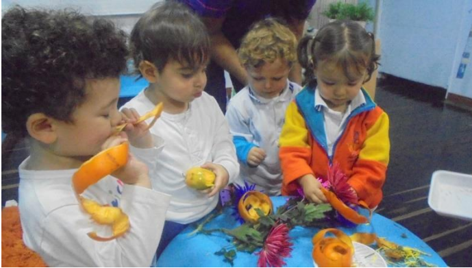
imagen 22: experiencia con alimentos jardín platero y yo

El olfato comunica con el cerebro y a él se le asocian las emociones más profundas y directas. Es el menos condicionado culturalmente, la memoria olfativa es inmediata, un olor tiene que ser un fuerte poder evocador, debe ser capaz de despertar imágenes y recuerdos de ambientes.