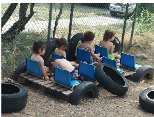
imagen 18: ambiente de juego creativo jardín Els Pins.

El ambiente se debe concebir como un espacio polisensorial, no tanto en cuanto a que debe ser rico en estímulos, sino que debe estar acompañado de valores sensoriales diferentes, para que cada uno se pueda sintonizar según las propias características de recepción individual.