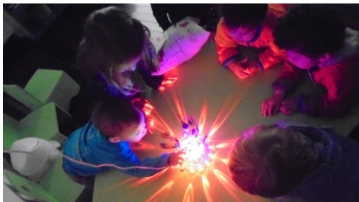
imagen 21: niños en mesa de luz jardín platero y yo

La luz es uno de los grandes componentes emotivos de nuestra percepción y se convierte para los niños en una materia viva manipulable y utilizable para producir propias configuraciones estéticas: