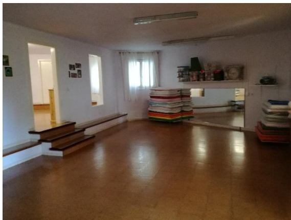
imagen 26: salón antes de realizar la práctica jardín Els Pins

El desarrollo de la actividad se distribuiría en diferentes espacios.