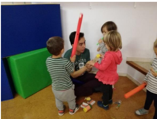
imagen 8: Momento de pregunta en la actividad de construcción niños Els Pins

Esta imagen comprende unos aspectos a tener en cuenta a la hora de interactuar con un niño: