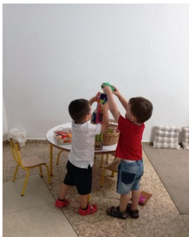
imagen 6 y 7: actividad social de construcción y juego compartido niños Els Pins