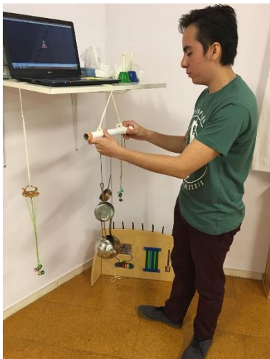
imagen 29: Creación del rincón de estructuras

Para este rincón tuve que fabricar pequeñas estructuras, con las que los niños pudieran hacer diversos sonidos. No obstante ya contaba con una estructura que me había prestado el jardín Els Pins .