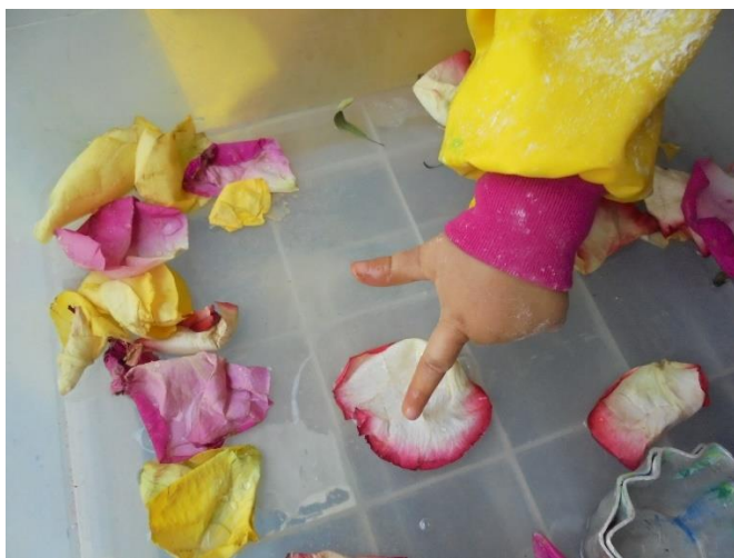
IMAGEN I: APRENDIENDO A TRAVÉS DEL SENTIR