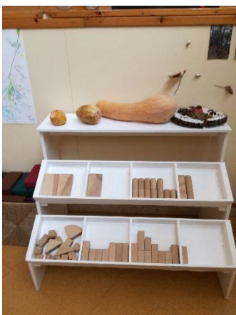
Imagen 17: cálidos espacios y presentación estética de materiales jardín Els Pins

Las educadoras me explicaron que la necesidad de confort de los espacios era tan necesaria para ellas, como para los niños. De ahí deduje la crucial importancia de un ambiente apropiado para aprovechar al máximo el proceso de aprendizaje en tan temprana edad.