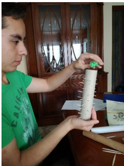
Imagen 27: creación del palo de lluvia

Para los instrumentos prefabricados, dispuse de envases de colocao vacíos, tapas de metal, cascabeles, hilo de color verde, y pepitas de colores; para que con esos materiales, se pudiera fabricar sonajeros y castañuelas.