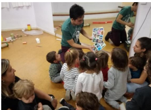
imagen 34: escuchando sonidos jardín Els Pins

Después reuní a los niños en el espacio de elaboración y con su ayuda fabricamos los sonajeros. Yo los ayudaba abriendo los envases y ellos echaban las pepitas en el tarro. Pocos niños fueron los que quisieron interactuar conmigo en relación a la fabricación de instrumentos. Se interesaron más en manipularlos ellos mismos