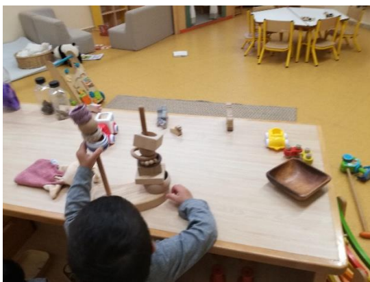
imagen 14: espacio de construcción jardín Els Pins

La forma en que se desarrolla cada área, afectará las oportunidades de espacios creados para actividades. Las áreas de alto uso deben ser repartidas a través de espacios disponibles, para que los niños se pueden inclinar más a trabajar como parte de grupos pequeños o como individuos, en vez de un solo grupo.