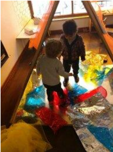
imagen 19: espacio creativo Luz y Color jardín Platero y yo

Cada niño es un sujeto único que decide y elige a su antojo cuando aprender. Por lo tanto, aprender es ante todo una elección libre del niño. El contexto, en este caso la guardería, definida y determinada por las relaciones e interacciones con los demás niños y con los educadores, así como también por los espacios, mobiliario y colores, determinan las posibilidades y cualidades de los procesos de autoaprendizaje.