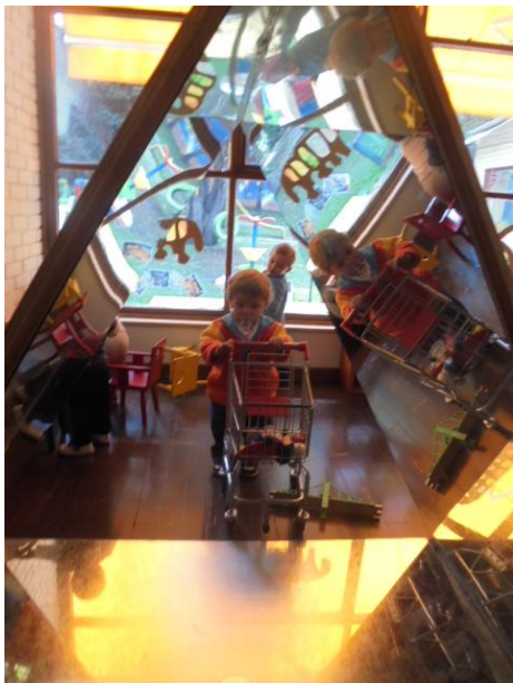
imagen 10: espacio que invita al encuentro jardín platero y yo

El espacio o ambiente en la primera infancia le proporciona al niño importantes mensajes y guías sobre lo que puede hacer, cuando y como lo pueden hacer, y como pueden trabajar juntos.