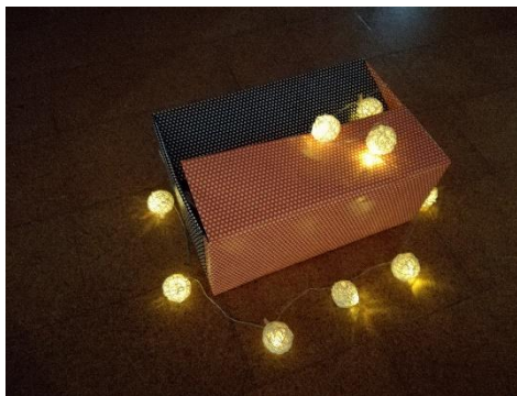
imagen 31: presentación de la provocación jardín Els Pins