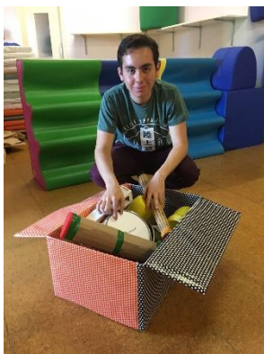
imagen30:provocación musical jardín Els Pins

Para la provocación cogí una caja de tamaño grande y, la forre con papel de regalo a dos tonos llamativos; además, compre un despertador lumínico, una bocina y un perro de hule, para que realizaran la función de producir luz y sonido que atrajeran a los niños.