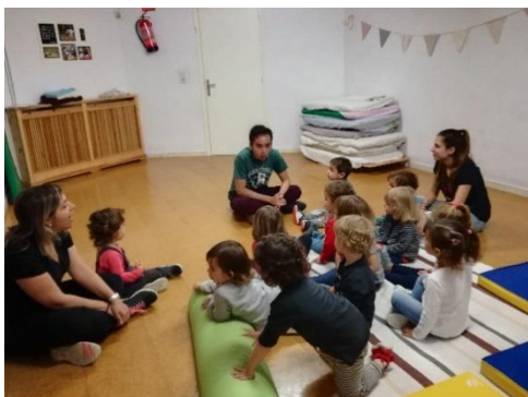
imagen 32: realización de la asamblea jardín Els Pins

Después de organizar los salones, subí para recoger a los niños.me acompañaba mi madre, la profesora tutora y una estudiante en práctica acompañándonos.