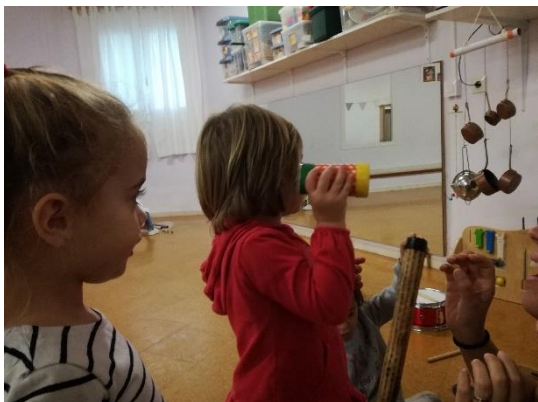
imagen 9: observando y aprendiendo jardín Els Pins

Tenemos que dejar que los niños sean niños. Los niños aprenden mucho de otros niños y los adultos aprenden de los niños al estar con ellos. Los niños aman aprender entre ellos y, aprender cosas que nunca hubiera sido posible enseñarles por medio de la interacción con adultos.