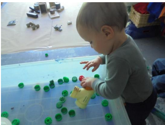
imagen 3: niño de un año descubriendo jardín platero y yo

Para Reggio Emilia, los niños son seres extraordinarios, complejos e individuales que existen a través de sus relaciones con los otros y siempre dentro de un contexto particular.