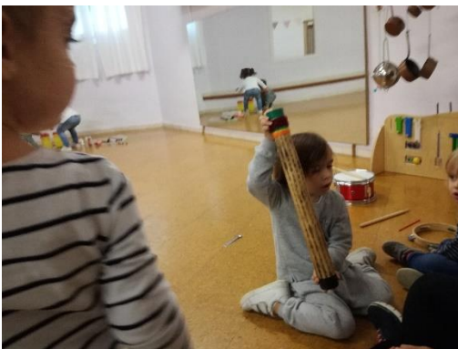
imagen 23: actividad musical jardín Els Pins

El ambiente que nos rodea está definido por sonidos que tienen una función mediadora entre el individuo y el ambiente, por lo tanto es necesario: