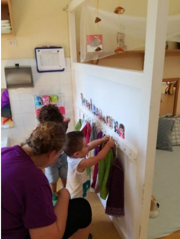
imagen 2 momento de cotidianidad, Els Pins

La Primera Infancia es una etapa exclusiva de cuidado y atención en la que se centra todos los esfuerzos de aprendizaje, a promover experiencias significativas de formación para la vida y la escolaridad, acordes con la edad y las características de los niños y las niñas.