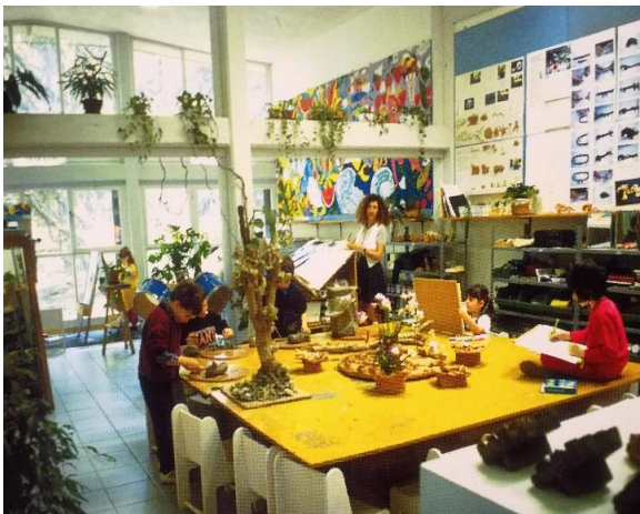
imagen 12: salón Reggio Emilia libro niños, espacios y relaciones.

El espacio de una de las escuelas de la infancia es una comunidad educativa donde la mente y la sensibilidad son compartidas.