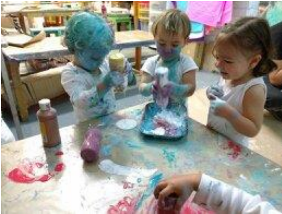
imagen 20: actividad color jardín platero y yo

Los niños tienen un amor natural por el color y responden continuamente a este. Es curioso como los adultos tienden a envolver al recién nacido en colores suaves y neutros en sus primeras semanas de vida y, después pasan a proponer colores fuertes y muy saturados como elementos cromáticos para la etapa de primera infancia.