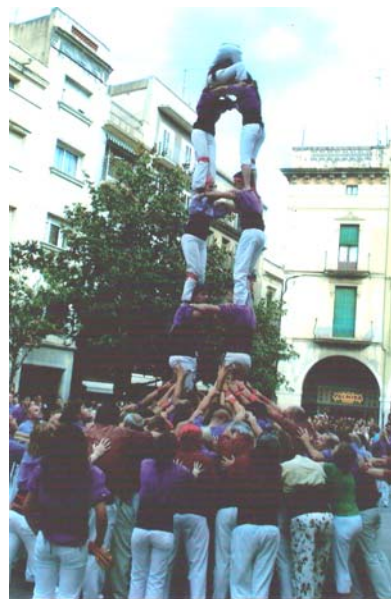
4d7 i 2d6 assolits a la Diada de Sant Pere per part de la Colla Casteller de Figueres.