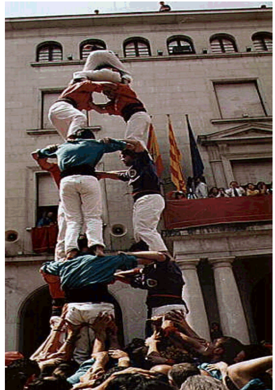
Foto del castell de germanor entre les tres colles.

El “bateig” o presentació oficial de la Colla, va tenir lloc el diumenge 4 de maig de 1997 a la Plaça de l’Ajuntament de Figueres, en el marc de les Fires i Festes de la Santa Creu. Van fer 2d6, 3d6 i 4d6a. Els “Padrins” varen ser els Castellers de Barcelona i la Colla Castellera de Sant Pere i Sant Pau, de Tarragona. Destaquem que al final de la diada, les tres colles varen fer un “castell de germanor”, en el qual cada part del castell la feia una colla.