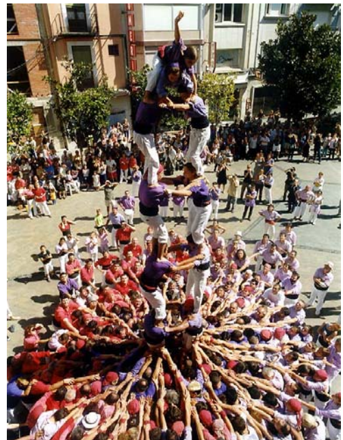
Torre de sis a la plaça de l'Ajuntament.

Cal destacar que l'any 2000, va ser la millor colla de castells de 7 de Catalunya.