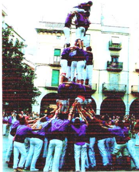
5d6 assolit a la Diada de Sant Pere per part de la Colla castellera de Figueres.

Acabada l'actuació, he volgut entrevistar-me amb els mateixos castellers que he parlat abans per veure que els ha semblat la diada i si continuen pensant el mateix respecte a la diada o ha canviat alguna cosa: