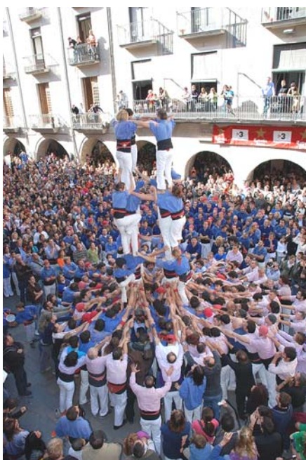
3) Els quarts estan col·locats i els quintes van pujant mentre els dosos es preparen.