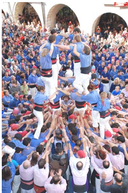
2) Els terços ja estan col·locats i els quarts van pujant.