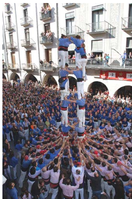
4) Els quintes ja són a dalt i els dosos estan a punt de col·locar-se.