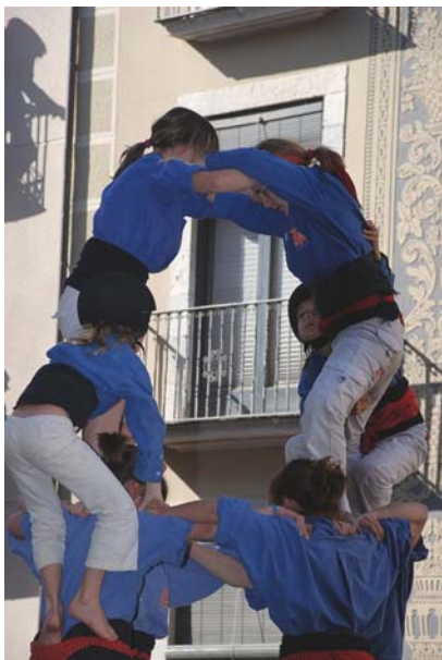
5) Els dosos estan col·locats, mentre l'acotxador i l'enganeta es preparen per col·locar-se també.