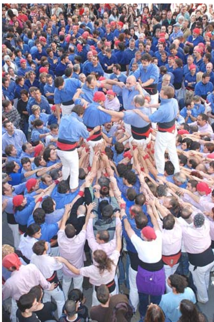
1) Els segons estan a dalt de la pinya I els terços a punt de pujar