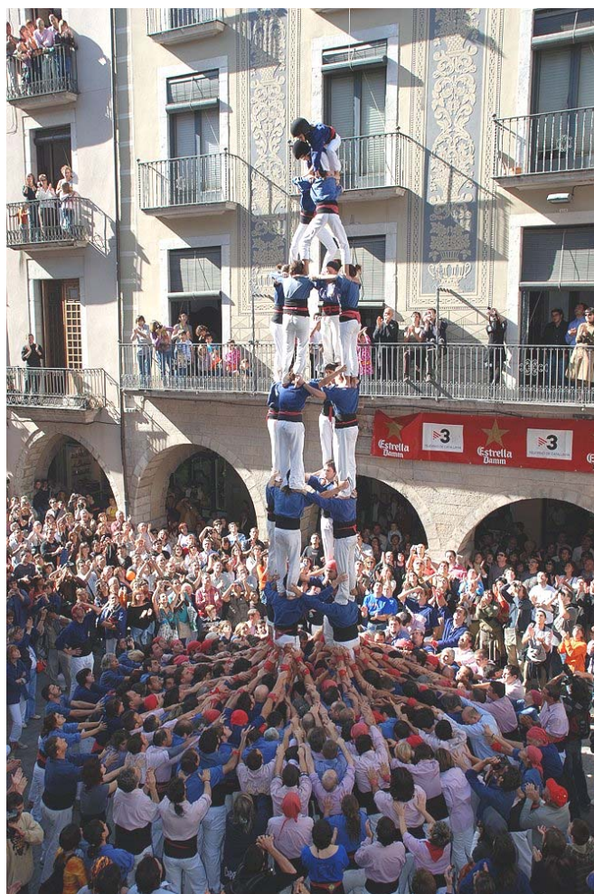
6) 4d8 carregat!