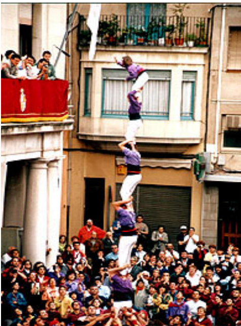
Pilar de sis a la Plaça de l'Ajuntament.